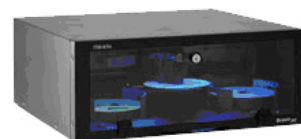
Rack-Mountable Disc Publisher XR