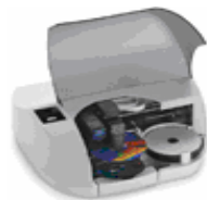
Desktop Disc Publisher SE

Hierbij heeft u de keuze uit de zeer voordelige desktop oplossing of de extra robuuste oplossing die in een rack geplaatst kan worden. Beide staan garant voor professioneel en geautomatiseerd dupliceren en printen van CD of DVD.